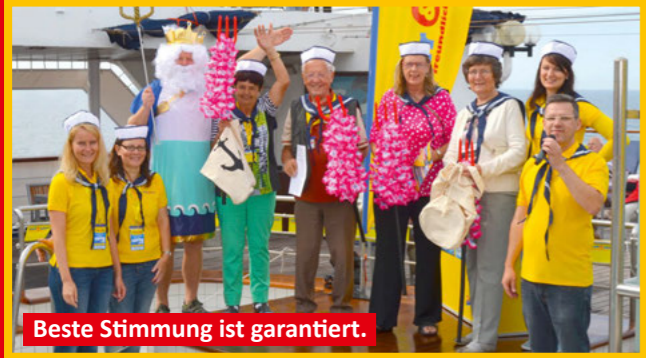
Beste Stimmung ist garantiert.